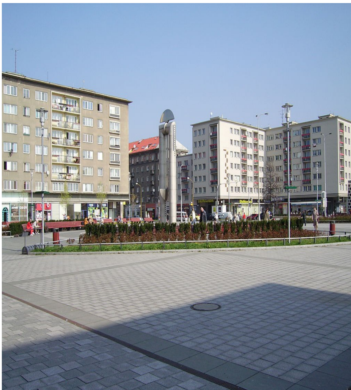
Náměstí Republiky, Statutární město Havířov, Moravskoslezský kraj.