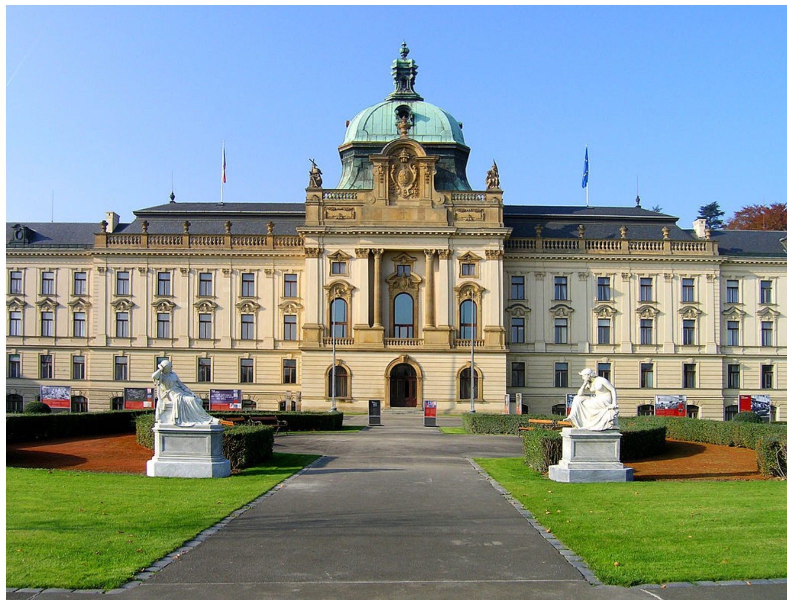
Strakova akademie – sídlo české vlády.