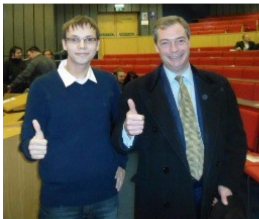
Mladý libertarián a odpůrce povinného čipování pan Miroslav Jahoda (Svobodní) a známý britský euroskeptik pan Nigel Farage (UKIP).