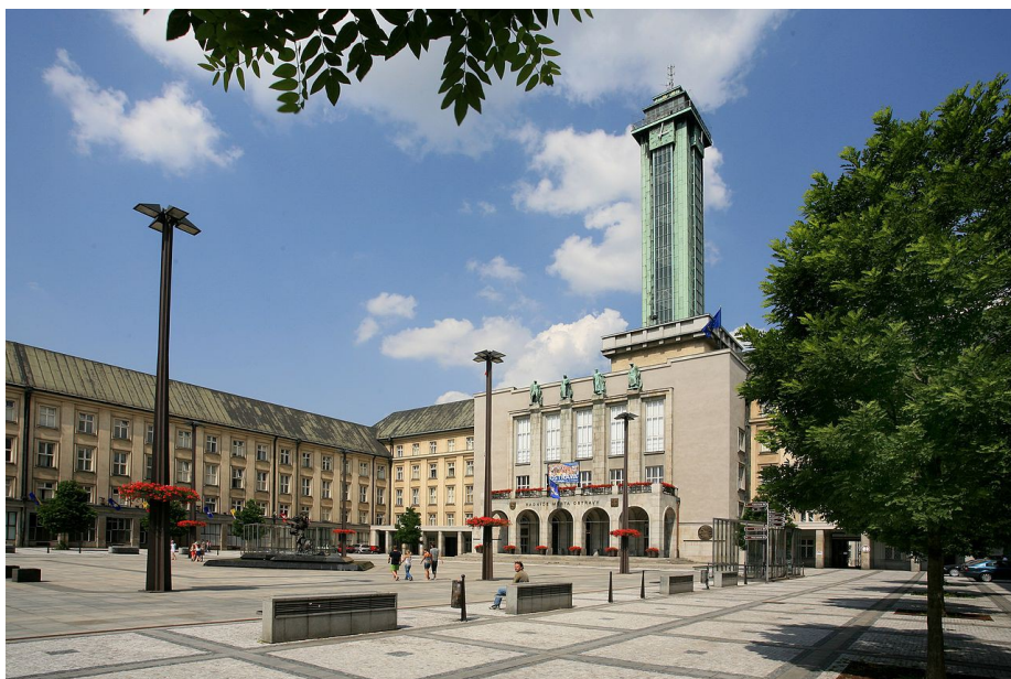
Magistrát Statutárního města Ostravy.