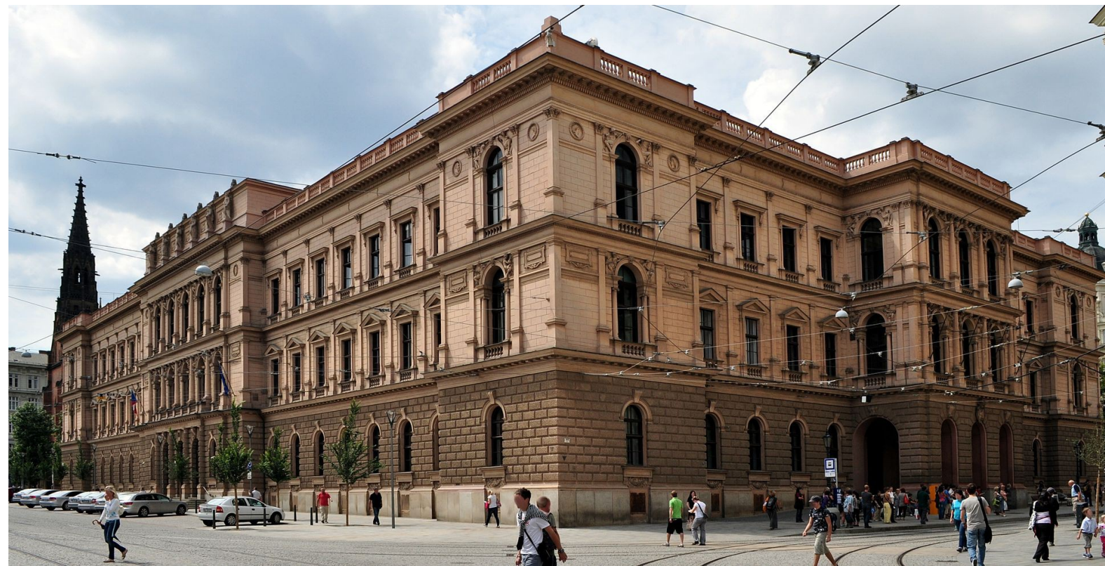
Sídlo Ústavního soudu České republiky v Brně – budova bývalé Moravské Zemské sněmovny. –

Zdroj obrázku: Millenium187; https://cs.wikipedia.org/wiki/Ústavní_soud_České_republiky#/media/File:Moravsk%C3%A1_Zemsk%C3%A1_Sn%C4%Bmovna_II.jpg