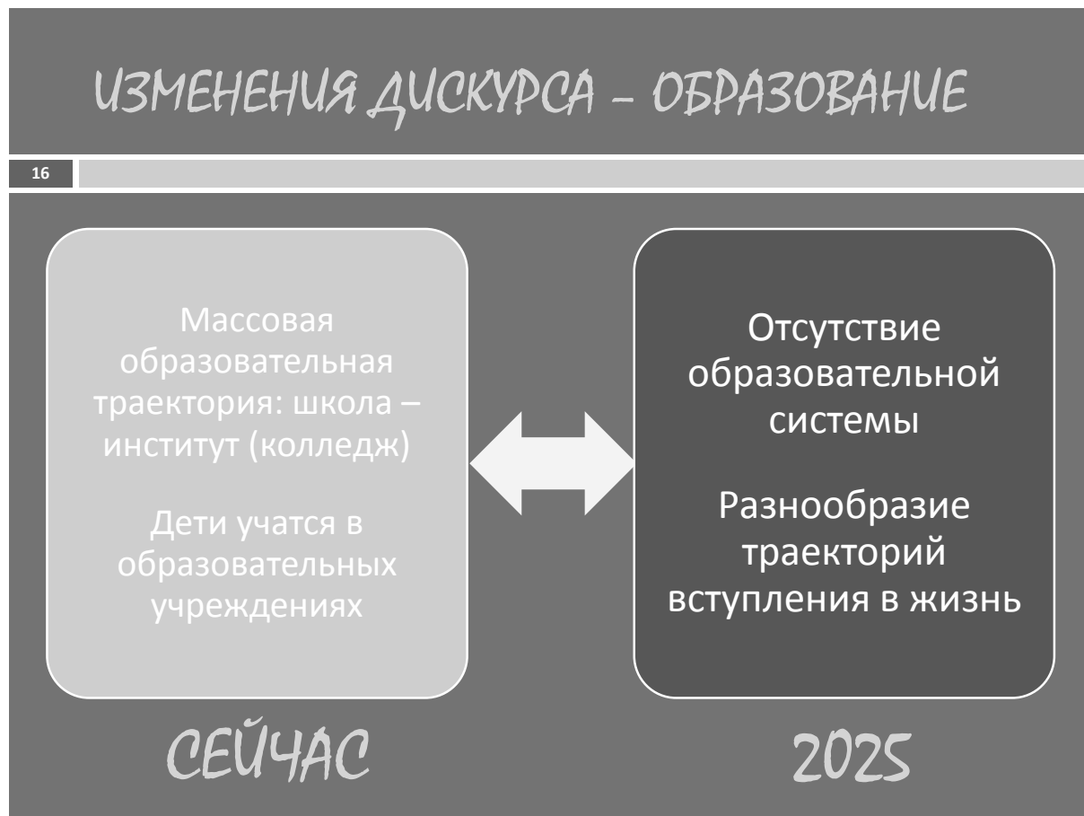
Рис. 7. Фрагмент дорожной карты «Детство-2030»: модернизация системы образования и воспитания

как просто можно проверить правильность написания глагола: нужно к нему задать вопрос «что делать?» или «что делает?». Если глагол отвечает на первый вопрос, то в нем, как и в слове «делать», пишется мягкий знак, если же он отвечает на второй вопрос – то мягкий знак не пишется.