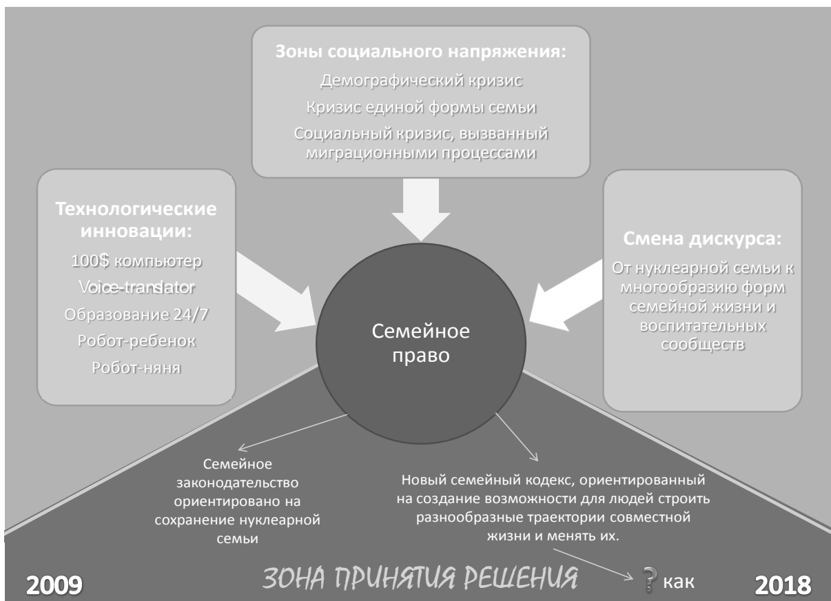
Рис. 5. Фрагмент дорожной карты «Детство-2030»: легитимизация либеральным трендам как ответ на вызовы будущего

Очевидно, что подобного рода выводы не могут быть сделаны на основании ознакомления с заглавными, эмоционально-экспрессивными императивами, провозглашаемыми пропагандистами изучаемого проекта: обертка серьезно отличается от содержимого. Более того, выявляется вполне четкое противоречие заявляемого и фактически развиваемого идейно-мировоззренческого материала. Это, в свою очередь, подтверждает ранее высказанную мысль о том, что современник обязан очень тщательно относиться к метафизической плоскости собственной жизни, обдумывая и осмысляя появляющиеся концепции.