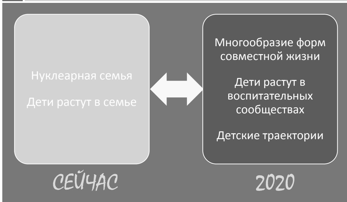
Рис. 4. Фрагмент дорожной карты «Детство-2030»: ретроградные устои бросают вызов либеральным трендам

В указанном разделе можно прочесть следующее: «В случае невозможности по тем или иным причинам сохранить традиционную форму семьи, пары вынуждены прибегать к процедуре развода. Юридическое оформление процедуры подразумевает присуждение детей одному из родителей, что в итоге законодательно и институционально нарушает траекторию развития детей. А если учесть то, что в некоторых цивилизованных странах до 80 % браков заканчиваются разводом, то можно представить, какое количество детей пребывает в заблуждении (выделено мной – М. Ф.), что связаны только с одним родителем. Происходит расслоение детей на тех, у кого родители разведены, либо отсутствуют, либо не принимают участия в их воспитании, и на тех, у кого традиционная форма семейных отношений пока сохранена (выделено мной – М. Ф.) [5].