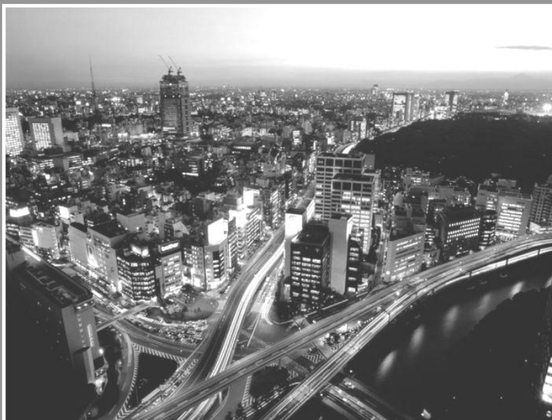
Рис. 1. Фрагмент дорожной карты «Детство-2030»: неоднозначно-противоречивый посыл к выводам

□ СМОЖЕТ ЛИ РОССИЯ ОСТАТЬСЯ ЖИЗНЕСПОСОБНОЙ В МЕНЯЮЩЕМСЯ МИРЕ?