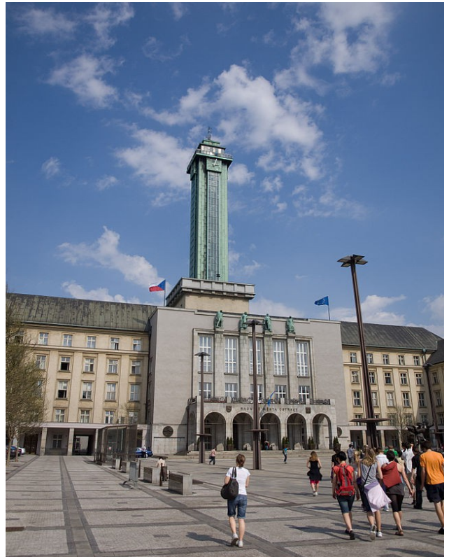
Budova Nové radnice v Ostravě.

C) Velmi důležité informace dále poskytl k analýze praktického fungování systému vynucování čipování psů a jejich navracení zpět domů k majitelům hlavně na základě svých dlouholetých zkušeností Vážený pan ředitel Městské policie Ostrava. Podle jeho oficiálních údajů opatřených úředním razítkem