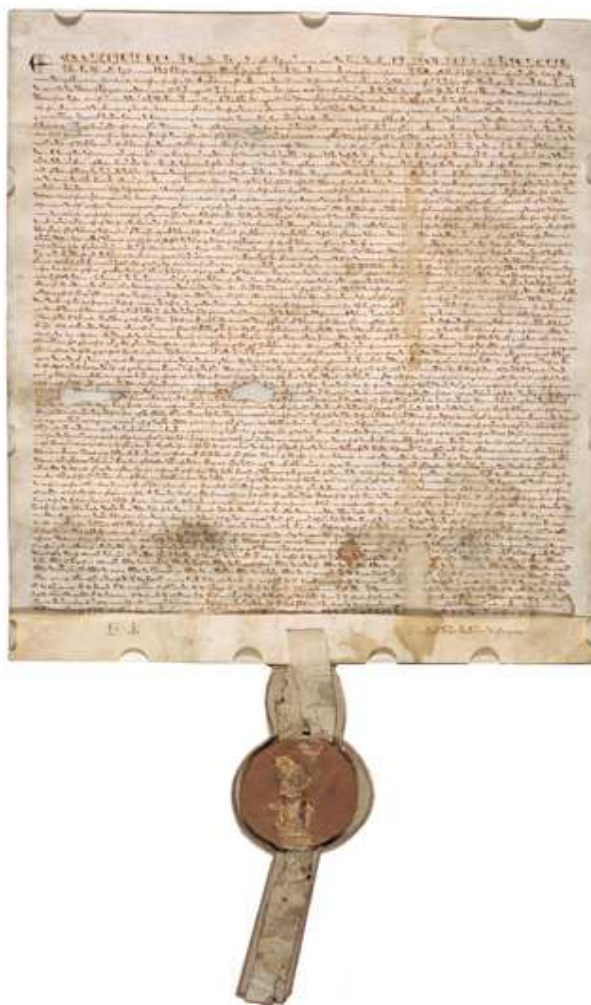
"Magna charta libertatum" "Velká listina práv a svobod" z roku 1297.