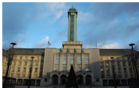
Nová radnice v Ostravě.

Vážený pan primátor Tomáš Macura z hnutí ANO na druhé straně alespoň poskytl veřejnosti plný, necenzurovaný prostor k vyjádření všech názorů. Dále vysvětlil občanům přímo na pořizovaný oficiální záznam, že i přes takový vývoj situace dojde v blíže neurčené době (možná ještě tento rok) k netrpělivě očekávané/přislíbené systémové analýze (ne)úspěšnosti vymáhání implantací RFID mikročipů přímo do živých těl nejlepších čtyřnohých přátel člověka v Ostravě a k oficiálnímu pokusu o osvobození občanů/chovatelů ze špatně nastavených podzákoných tzv. 'čipovacích předpisů', které Ostrava zdědila ještě po minulých 'papaláších' z koalice ČSSD + ODS. – Nezákonné/neústavní vynucování označování pejsků čipem a související legislativní násilí tak bude zatím bohužel nadále v Ostravě pokračovat bez konkrétního/jasného termínu zjednání nápravy i po volebním vítězství hnutí ANO v ostravských říjnových komunálních volbách roku 2014!!! (SIC!). Vrchní velitel Městské policie Ostrava – Vážený pan primátor Macura – také ani občanům nesdělil, zda instruoval městské strážníky k tomu, aby vzhledem k výše uvedené situaci nepostihovali občany/chovatele psů v důsledku vymáhání/kontroly čipování jinak než maximálně domlouvou. Jen do 20. února 2015 šlo již o 81 občanů , kterým vznikla v přímé souvislosti s vynucováním čipování a použitým legislativním násilím ve městě újma.