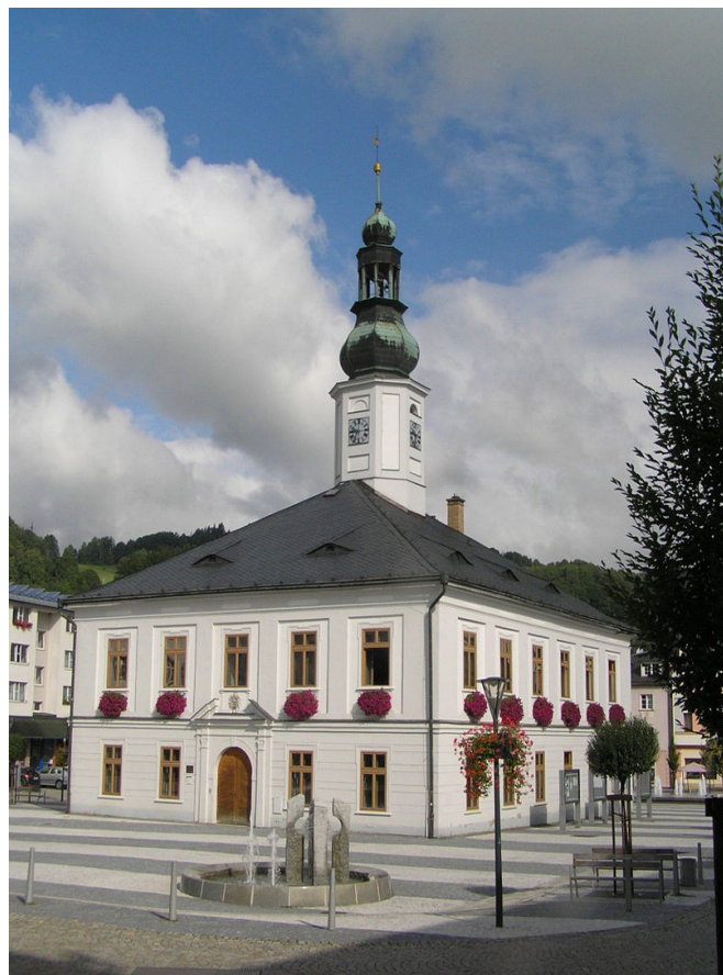
Radnice v městě Jeseníku. –