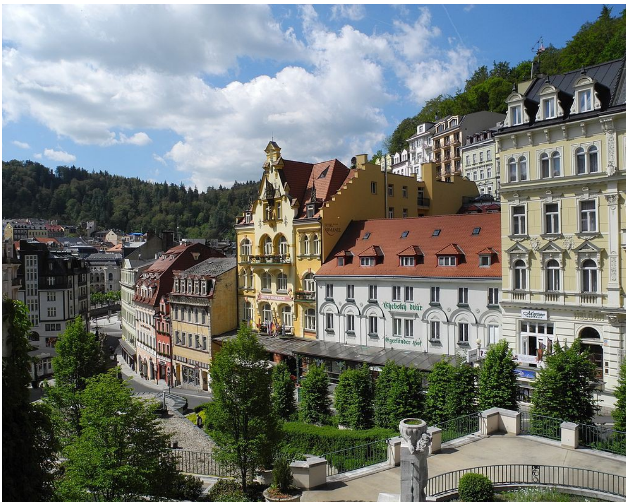
Karlovy Vary.