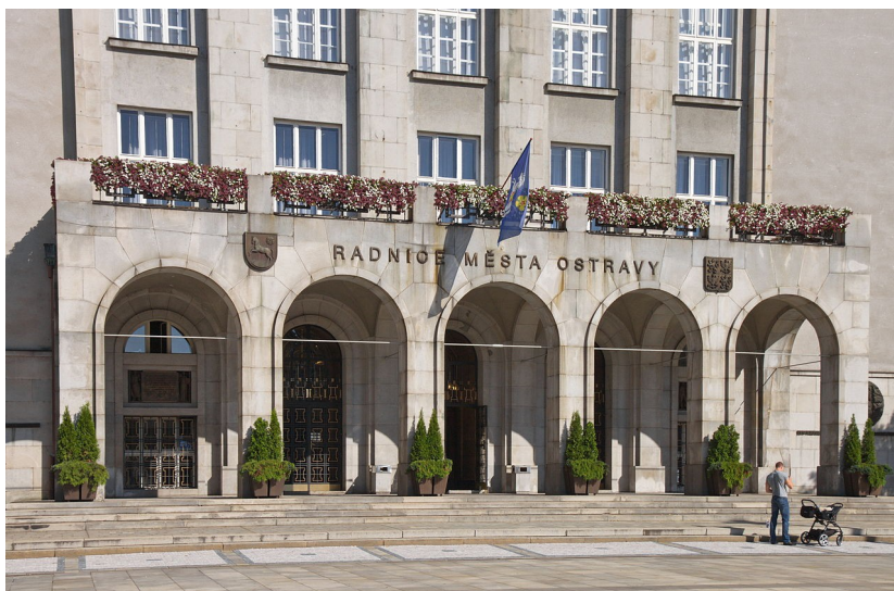
Budova Nové radnice v Ostravě. –

Ministerstvo vnitra České republiky se opět důrazně zastalo ostravských občanů! Kvůli pokračujícímu porušování ústavně a zákonně garantovaných přirozených práv/svobod Ostravanů při jednání Zastupitelstva Statutárního města Ostravy (ZSMO) a dalšímu posilování tohoto neblahého trendu ve výročí řídicího jednání ZSMO už dokonce ministerstvo doporučilo odvolání ostravského primátora z jeho veřejné funkce včetně zásahu správní justice! Občanům se totiž doposud nikdo za výše způsobenou újmu ani neomluvil! ZSMO však alespoň uznalo, že se bude řídit dozorovými opatřeními Ministerstva vnitra ČR! – Společenství webu Necipujtenas.CZ již několikrát informovalo o tristním vývoji situace po loňských (2015) i letošních (2016) nezákonných a neústavních/cenzurních zásazích