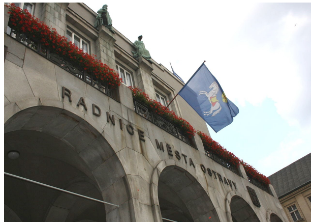
Budova Nové radnice v Ostravě. –