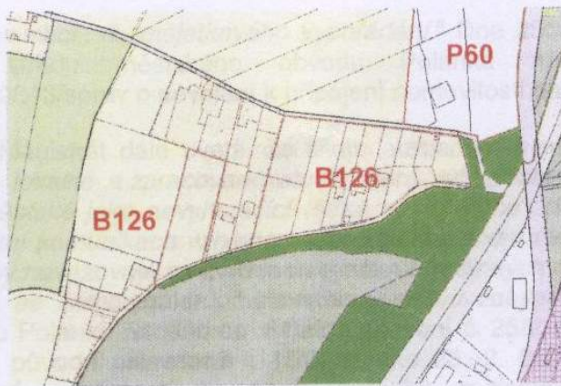
Výřez katastrální mapy s vyznačením jednotlivých stavebních objektů (obrázek č. 2):