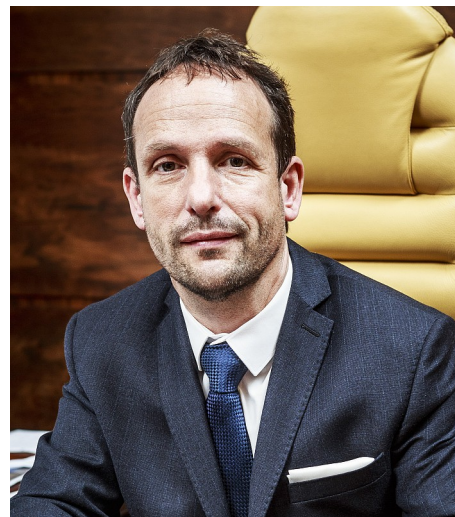
Vážený pan primátor Statutárního města Ostravy Ing. Tomáš Macura, MBA (zvolený na kandidátce hnutí ANO).