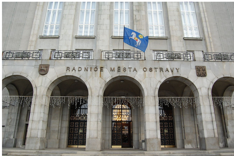
Budova ostravské Nové radnice.